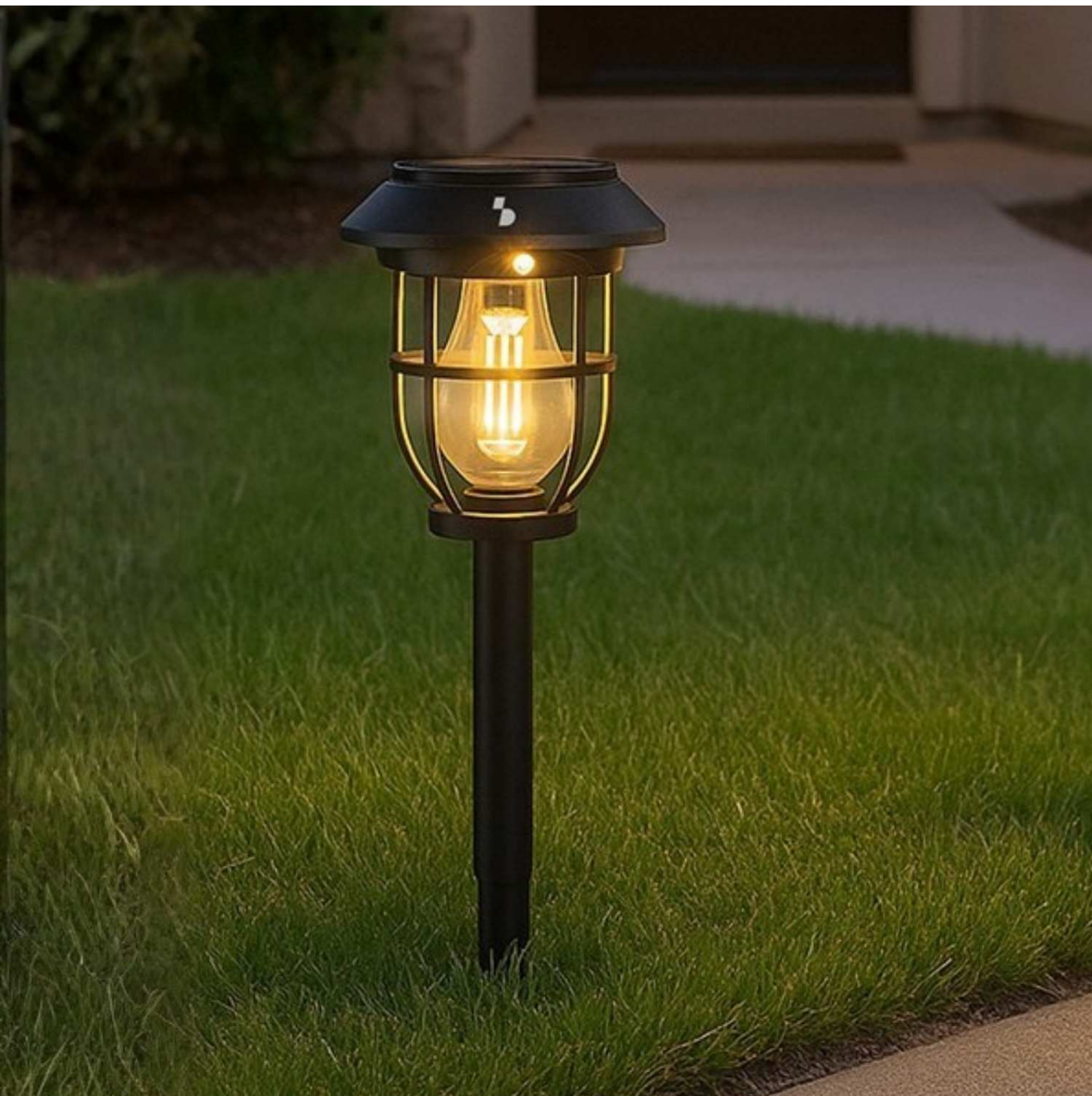
Lampe solaire avec capteur de mouvement LUCERNA