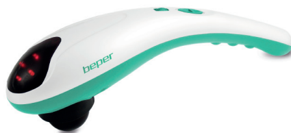
40.942 Body infrared massager