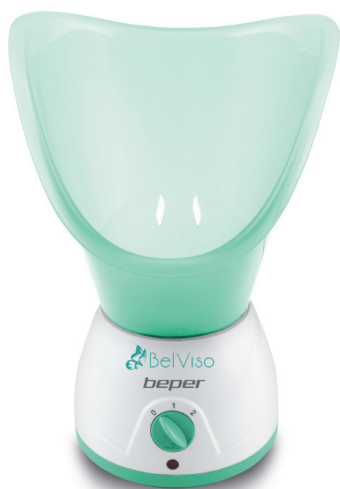
40.967N Facial Sauna and aromatherapy