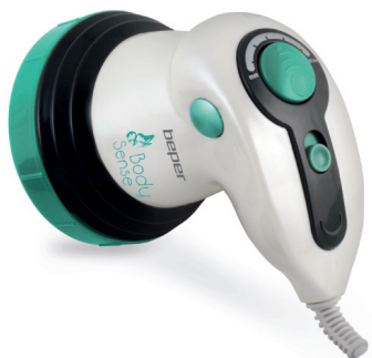
40.946 Professional lipomodelling system