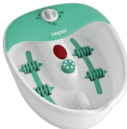
40.949 Foot massager