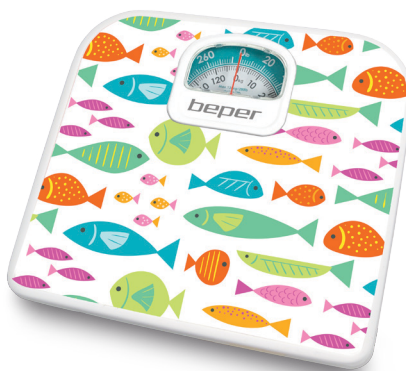
Body scale Cod.: 40.812F2