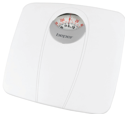
Body scale Cod.: 40.813