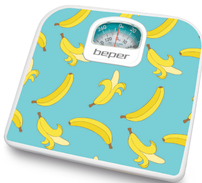
Body scale Cod.: 40.812F1