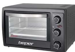
Toaster oven Cod.: 90.885 35L