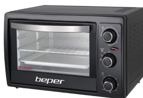
Toaster oven Cod.: 90.883 20L