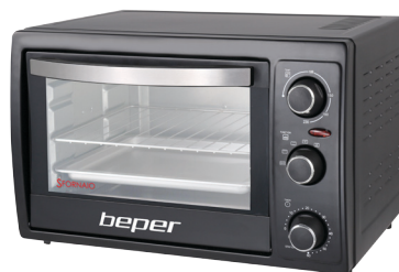
Toaster oven Cod.: 90.887 55L