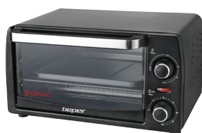
Toaster oven Cod.: 90.882 12L