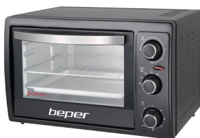
Toaster oven Cod.: 90.886 45L