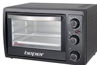
Toaster oven Cod.: 90.884 30L