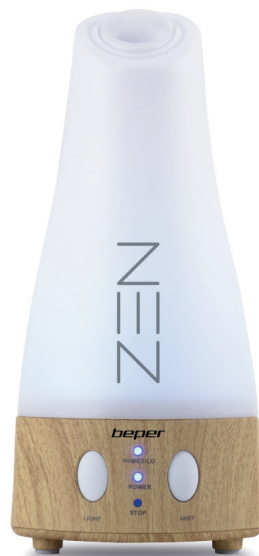
70.411 Essential oil diffuser