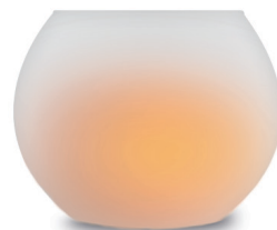
70.085 Led candle