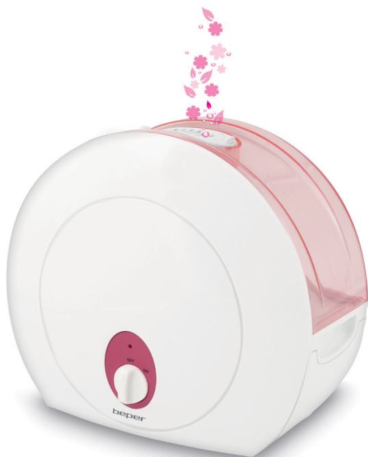
70.410 Humidifier with aroma oil box